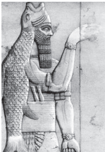
Дагон, суу перилеринин кудайы. Бул барельеф Мосул шаарынын түштүгүндө, 30 км аралыкта жайгашкан Нимруддагы буткананын дубалынан табылган.

ичинде тарыхтагы эң кооптуу эл болгон мидиандардын аскерин талкалашкан. Шамшынын жеңиши мындан да күчтүү таасирде калтырат. Ал жалгыз Дагон жалган кудайынын заңгыраган бутканасын кыйратып, анын ичиндеги бүт аймактан чогулган бутпарас динкызматчыларды жок кылган.